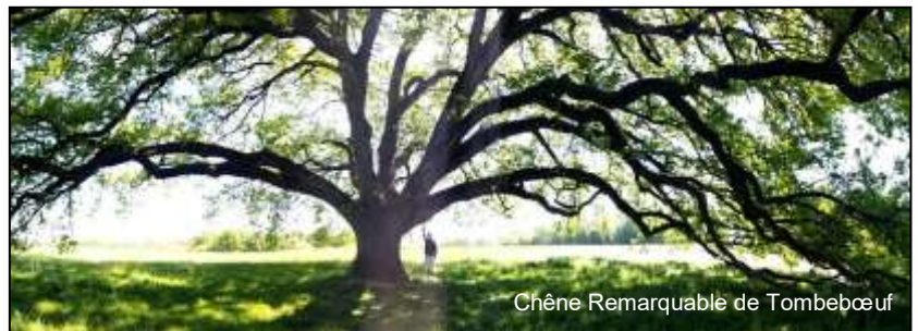
Chêne Remarquable de Tombebœuf